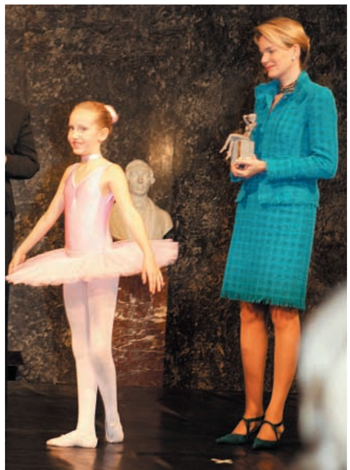
La Princesse Mathilde offrant les Awards.

Je vous souhaite une agréable soirée pleine d'espoir pour l'avenir.