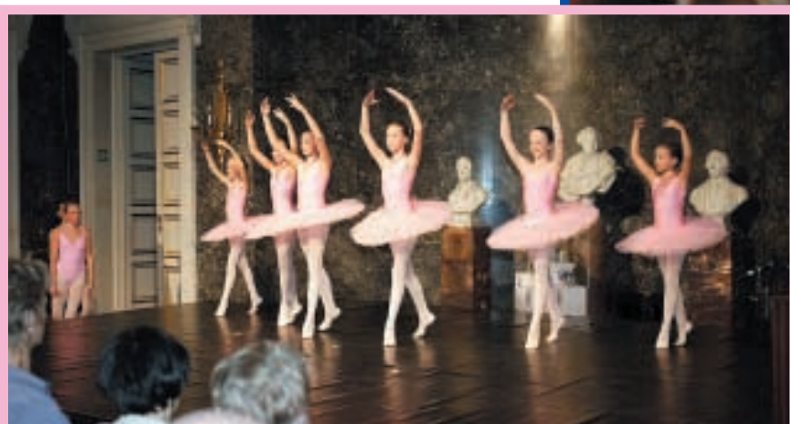
Le spectacle était assuré par les élèves de l'école de danse Mouvement. De leerlingen van de dansschool Mouvement verzorgen een deel van de voorstelling.

EDB Awards thanks: Novartis Oncology, Estée Lauder Companies, Johnson & Johnson – Breast Care, Astra Zeneca Oncology