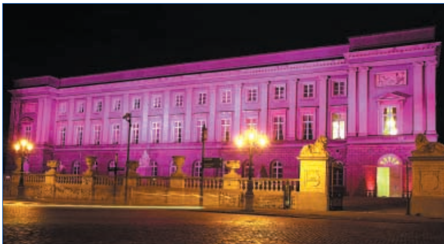
Le palais des Académies, éclairé en rose par Estée Lauder à l'occasion des EDB Awards. Het paleis der academiën, door Estée lauder in het rose verlicht, ter gelegenheid van de EDB Awards.

Sous le Haut Patronnage de Son Altesse Royale la Princesse Mathilde Onder de Hoge Bescherming van Hare Koninklijke Hoogheid Prinses Mathilde Unter der Hohen Schirmherrschaft Ihrer Königlichen Hoheit Prinzessin Mathilde