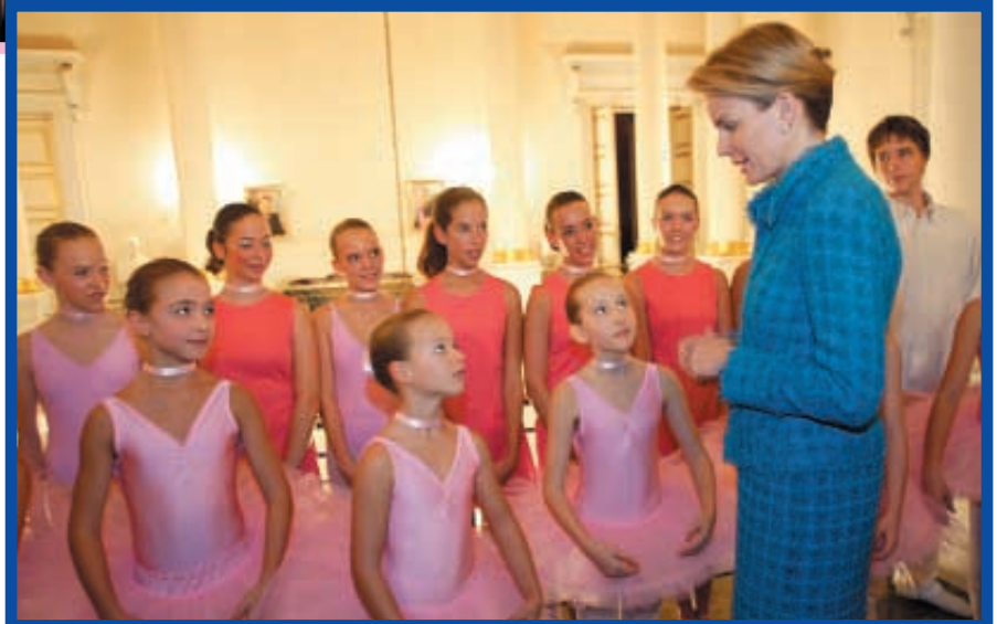
SAR échange quelques mots avec les petites danseuses. HKH wisselt enkele woorden met de danseresjes.